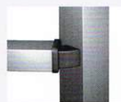
Scharnierconstructie niet 90° hoek